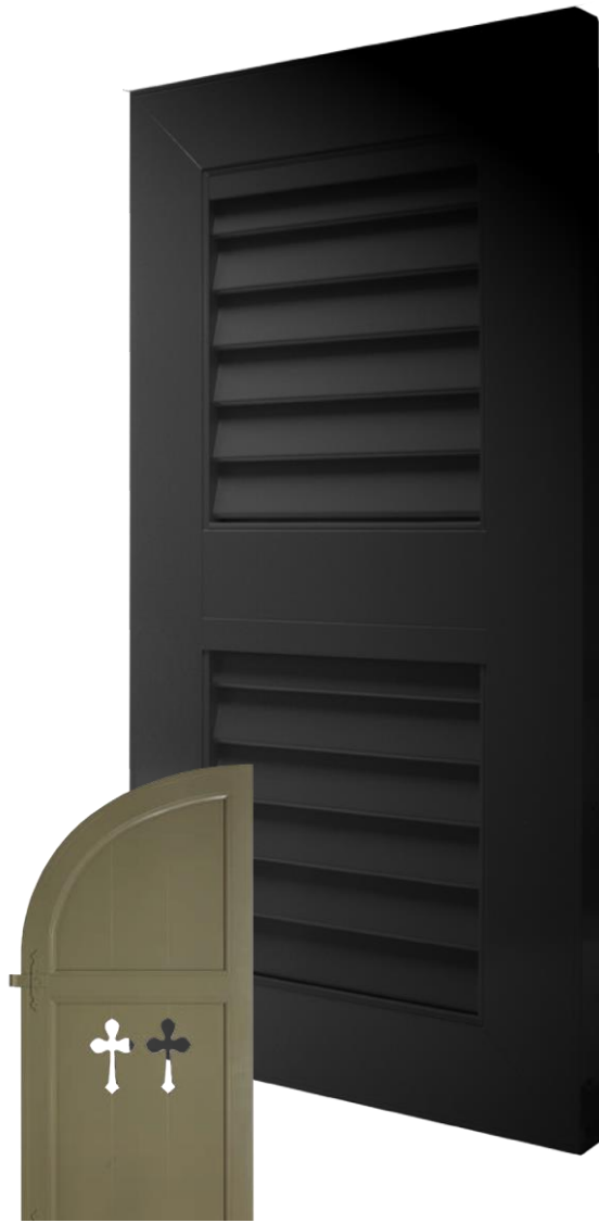
Cintrage Biegen Con Lato curvo